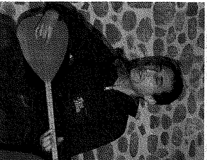
Musique kurde en intermède...