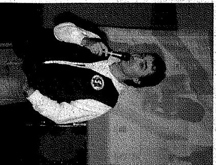
L'un des représentants de Pompiers sans Frontières